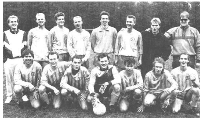
återigen i division 6.