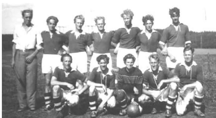
Borgstena IFs första fotbollslag 1946