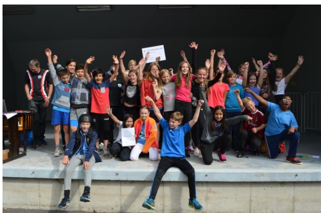
Vammarskolans segrande lag