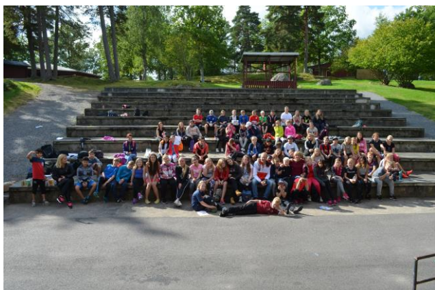
Alla förväntansfulla elever före start