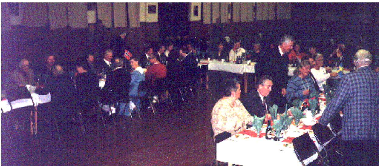
Panorama över bankettborden i Ex-huset vid IVO.