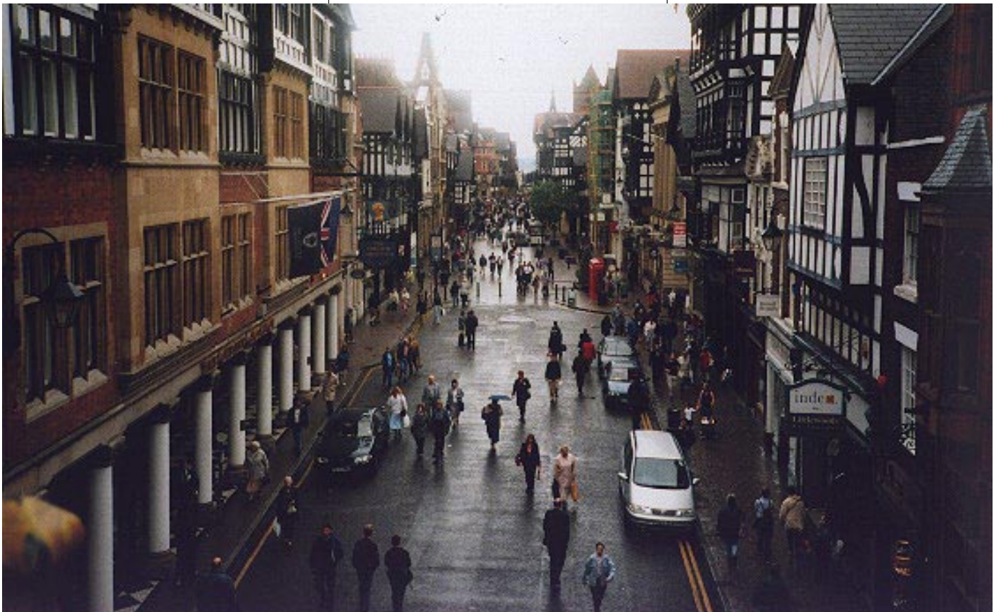
Vy från Chester, tagen uppepå ringmuren ner mot huvudgatan. Här, som överallt annars i dessa trakter, regnade det allt som oftast. annars var där trevligt.

Vi gjorde en dagsutflykt till den närbelägna staden Chester, anförda av den plötsligt utsedde