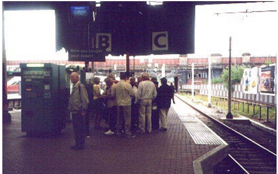
Chester-gruppen samlad på perrongen i väntan på spårvagnen.

Manchester är en hård stad. Man måste passa sig när man är ute och går på kvällarna. Att gå till bankomaten ensam på kvällen var inte att tänka på, det fick vänta till nästa dag även om kontanterna var slut. Det stod skumma typer lite varstans. Så långt var det ju ingen större fara, jag går inte till bankomaten hemma på Järntorget mitt i natten heller. Några av våra medresenärer bevitnade ett rån. En liten bil körde upp på trottoaren utanför en affär som sålde juveler och andra dyrbarheter. En maskerad man rusar in i affären, för att strax därefter rusa ut igen med en påse i handen. Bilen ger sig iväg, och lyckas klämma sig emellan de större bilarna på gatan och försvinner i fjärran. Massor av poliser och väktare kommer och tar upp jakten.