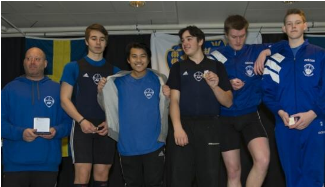
Vårt JSM guldlag