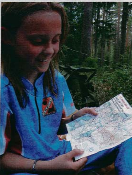
Nöjd. Saga Sander OK Milan, orienterade bra.

Vilken fin PR för tävlingarna av Ingvar Hultman på Länsposten!