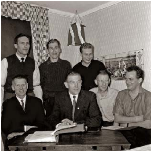
Styrelsemöte Hasselbacken slutet 50-talet