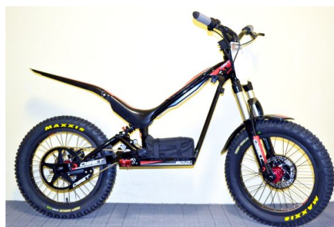
Klubbens eltrial för nybörjare