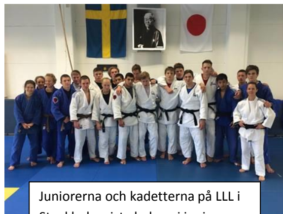
Juniorerna och kadetterna på LLL i Stockholm sista helgen i juni