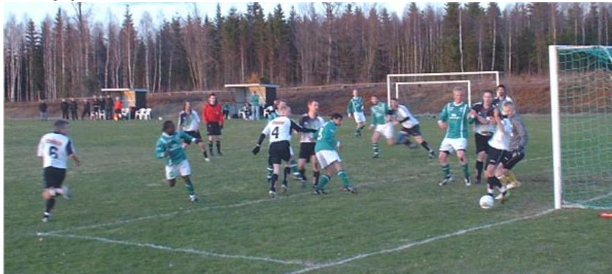
Seriepremiär hemma mot Hinnersyd

SBoIF avverkade i år sin tionde raka säsong i div. IV och ingen av de elva konkurrenterna kunde visa upp en motsvarighet. Det vittnar om en allmänt god och stabil insats under en längre tid. Ingenting har kvitterats ut gratis utan stora insatser har krävts varje år men den lilla klubben har på olika nivåer klarat uppgiften. Det är ingen tillfällighet om en förening kan visa upp en decenniumlång tillvaro i div. IV. Denna prestation kan aldrig ifrågasättas och det är en av de mest framträdande kriterierna på att alla de som ställer upp för sitt SBoIF gjort ett förnämligt jobb!