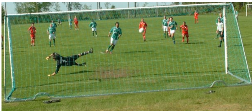
Iliad gör mål på straff hemma mot Torpa

SBoIF hade än en gång lyckats och därmed måste insatsen ånyo ett klart godkännande. Samtidigt måste den upplevas som en varningssignal. Trots allt blev årets säsong sämre än