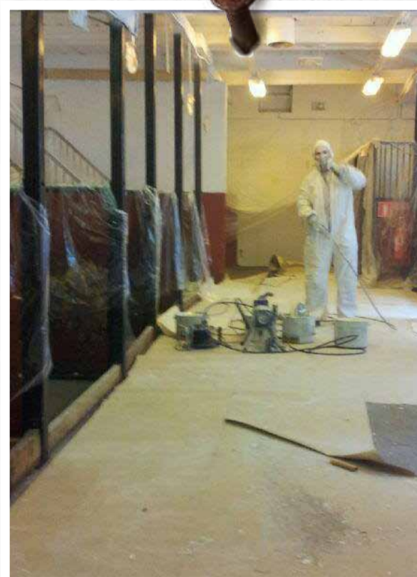
Det pågår ett kontinuerligt upprustningsarbete i stallet. Här målas taket i ponnystallet år 2013.