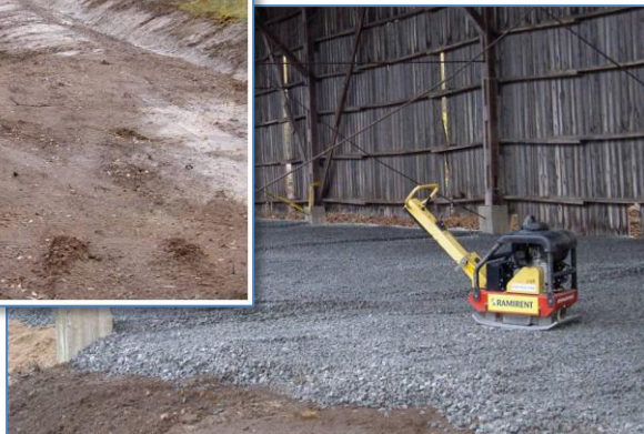
Ladan har förberetts för omvandling till stallar